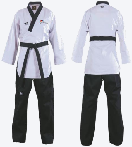
خاص بلاعي البومسي (إلزامي للاعبين والمدربين)