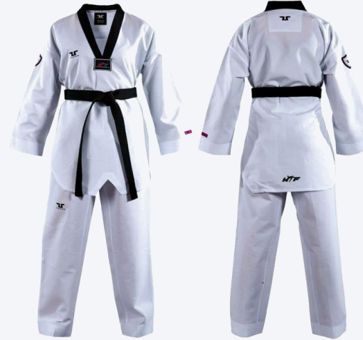
خاص بلاعي الكاروكي (إلزامي للاعبين والمدربين)