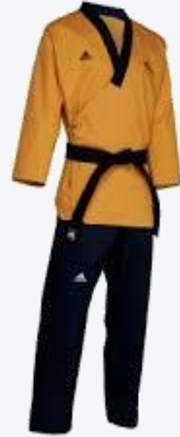
خاص بمدربي البومسي (اختياري للمدربين)