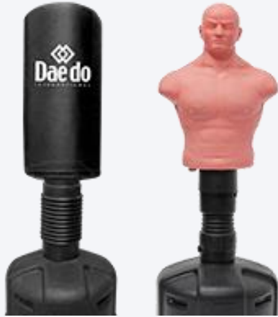
نموذج لمجسم التدريب