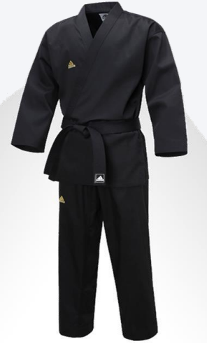
خاص بمدربي الكاروكي (اختياري للمدربين)