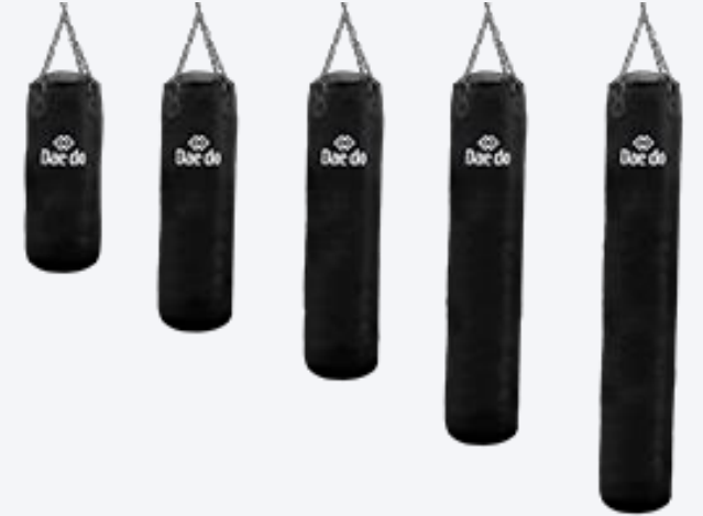
نموذج لأكياس التدريب المعلقة