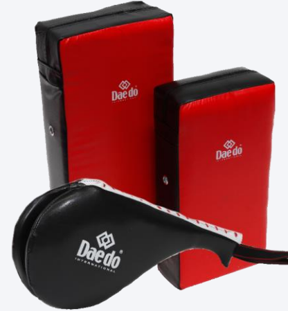
نموذج لمضارب التدريب